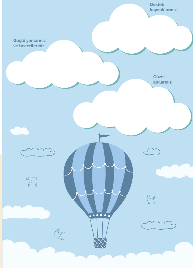
Balon gezisi görseli A4 boyutunda çıktı alınabilecek şekilde Ek-2'de yer almaktadır.

• "Etkinlik boyunca hangi duyguları hissettiniz?" diye sorularak yanıtlarını balona yazmaları ve gönüllü öğrencilerden sınıfla paylaşmaları istenir ve etkinlik olumlu geri bildirimlerle sonlandırılır.