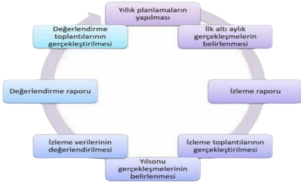
Şekil 7: İzleme ve Değerlendirme Süreci

İzleme ve değerlendirme sürecinin işleyişi ana hatları ile aşağıdaki şekilde özetlenmiştir. MEB 2024–2028 Stratejik Planı’nda yer alan performans göstergelerinin gerçekleşme durumlarının tespiti yılda iki kez yapılacaktır. Ara izleme olarak nitelendirilebilecek yılın ilk altı aylık dönemini kapsayan birinci izleme kapsamında, MEB Stratejik Plan İzleme ve Değerlendirme Modülü vasıtasıyla, Strateji Geliştirme Başkanlığı tarafından harcama birimlerinden sorumlu oldukları performans göstergeleri ve stratejiler ile ilgili gerçekleşme durumlarına ilişkin veriler toplanarak konsolide edilecektir. Performans hedeflerinin gerçekleşme durumları hakkında hazırlanan “Stratejik Plan İzleme Raporu” Bakan, Bakan yardımcıları, birim amirleri ve kurum içi paydaşların görüşüne sunulacaktır. Bu aşamada amaç, varsa öncelikle yıllık hedefler olmak üzere, hedeflere ulaşılmasının önündeki engelleri ve riskleri belirlemek ve yıllık hedeflere ulaşılmasını sağlamak üzere gerekli görülebilecek tedbirlerin alınmasıdır.